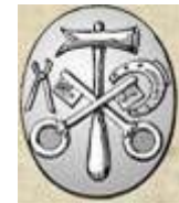
Wappen der Zünfte der Glaser (oben) und der Schreiner (unten)