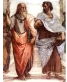
Aristoteles und Platon bei Arbeit No.4

Mehr zu Platon in Wikipedia -> und auf raffiniert -> (einem Philosophielexikon) Mehr zu Aristoteles in Wikipedia -> und auf raffiniert -> (einem Philosophielexikon) Arbeitspsychologie in Wikipedia