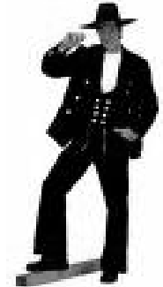
Zimmermannsgeselle auf der Wanderschaft

Heute wird als Geselle ein Handwerker bezeichnet, der eine Ausbildung in einem Beruf des Handwerks durch Bestehen der Gesellenprüfung vor der Handwerkskammer erfolgreich abgeschlossen und infolge dessen seinen Gesellenbrief erhalten hat. Früher mussten Gesellen anschließend auf Wanderschaft gehen, um bei anderen Meistern der gleichen Zunft zu lernen und Erfahrung zu sammeln. Die Wanderjahre, auch auf der Walze sein genannt, waren im Mittelalter eine Voraussetzung, um Meister werden zu können. Heutzutage ist die Wanderschaft freiwillig. Mehr im Wiki